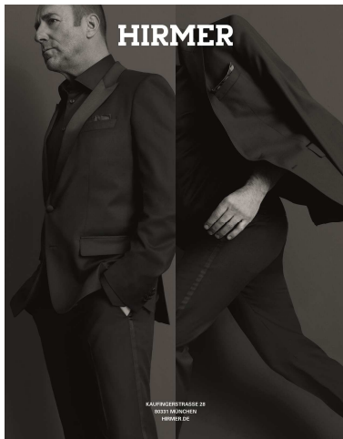
Schauspieler Heino Ferch in der HIRMER Imagekampagne 2019